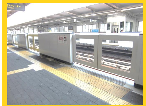
ホームドアも設置されています。